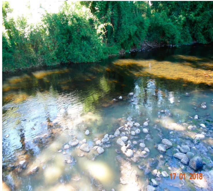
Imagen 2. Fotografía N° 2, IFA 2018