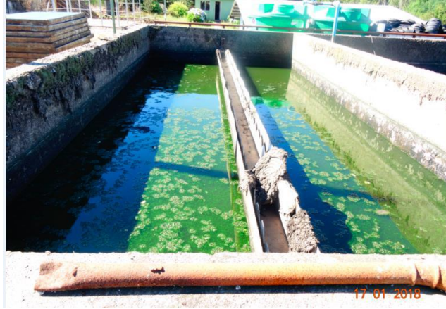
Imagen 3. Fotografía N° 2, IFA 2018