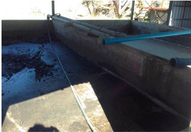
Imagen 4. Fotografía N° 2, IFA 2018