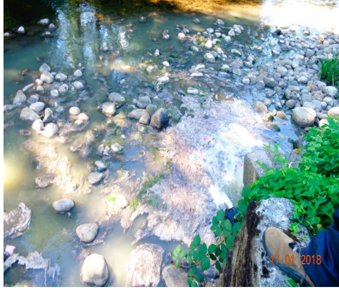
Imagen 1. Fotografía N° 1, IFA 2018