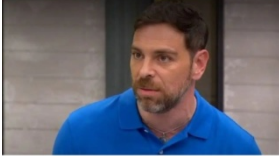
El periodista dejó ver sus dudas sobre el caso en La Red.

Esto, mientras el Ministerio Público dio cuenta de la designación de un fiscal con dedicación exclusiva para indagar las circunstancias de la muerte del inspector Luis Morales Balcázar.