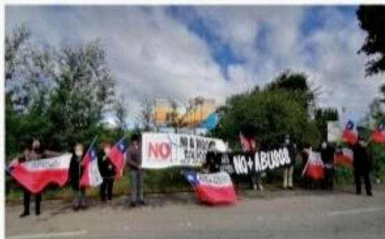
LOS VECINOS DE EL CIRUELO han continuado con sus reclamos por las obras del parque eólico.

Sin embargo, aunque el mail fue remitido el miércoles pasado, hasta la fecha no se ha tenido un pronunciamiento formal de la compañía.