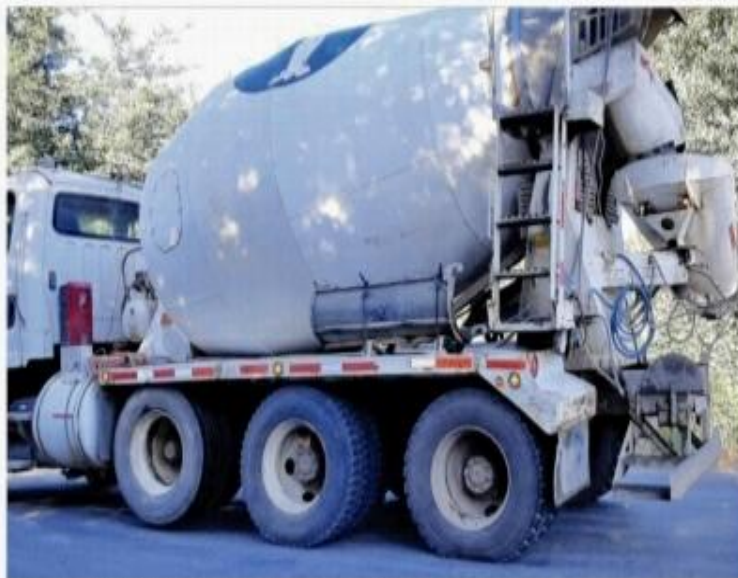
EL PASO DE CAMIONES de alto tonelaje para levantar los gigantescos aerogeneradores.

Mellado sostuvo que uno de los mayores impactos es el paisajístico debido a que varios de los aerogeneradores estarán situados a menos de 200 metros de