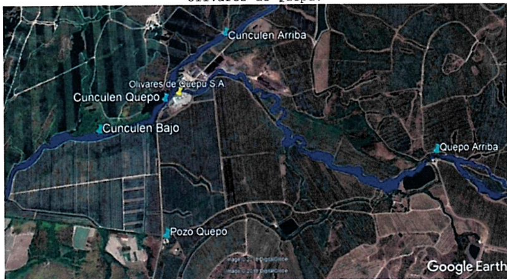
Figura 5: Lugares de muestreo aguas arriba y abajo respecto a la Planta Olivares de Quepu.

Sexagésimo sexto Que, además, se tuvieron a la vista los antecedentes del 'Estudio Técnico CER', el cual define claramente su alcance y objetivo, a saber, la determinación del estado actual de los suelos bajo la aplicación del alperujo y el efecto sobre el suelo y los cursos de aguas superficiales y subterráneas. El referido estudio -que siguió una metodología ampliamente aceptada y consensuada por el Departamento de Agricultura de Estados Unidos ("USDA") y la Sociedad Chilena de Ciencias del Suelo ("SchCS")-, se basó en la evaluación in situ de los suelos; realizó muestras de calicatas y análisis de laboratorio, en predios con y sin aplicación del alperujo; elaboró una evaluación y análisis de los perfiles, con su respectiva clasificación técnica y estableció las condiciones físico-químicas de los suelos. Adicionalmente, con el fin de establecer diferencias y similitudes entre los predios estudiados; y comparó los resultados con información de referencia oficial de otro estudio agrológico disponible en la zona realizado por el Centro de Información de Recursos Naturales 'Estudio Agrológico VII Región' de CIREN, 1997. El estudio agrológico de CIREN incluye un mapa básico de suelos, las clasificaciones interpretativas de capacidad de uso, categoría de riego, clases de drenaje, aptitud frutal, aptitud agrícola y erosión de los suelos, y estableció la influencia de la planta sobre la calidad de las aguas superficiales y subterráneas (Figura 5).