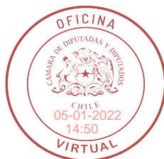
Francesca Muñoz González H. Diputado de la República

3.- Agréguese a continuación del punto aparte, lo siguiente: “En el caso de que la empresa cuente con más de 500 trabajadores, dicho porcentaje aumentará en un punto porcentual por cada 500 trabajadores.”