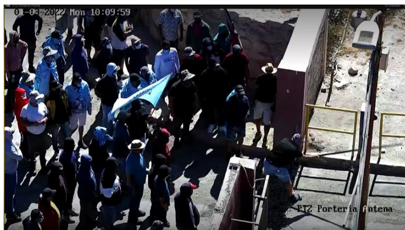
Huelguistas destruyendo barrera electrónica de acceso a la faena