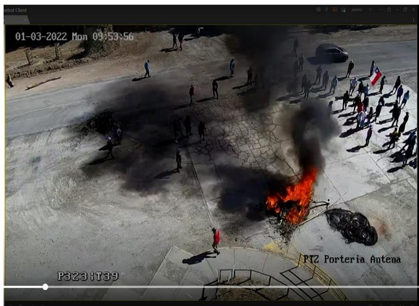
Huelguistas prendiendo fuego en las inmediaciones de la faena minera