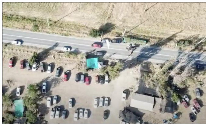
Vía hacia la faena minera