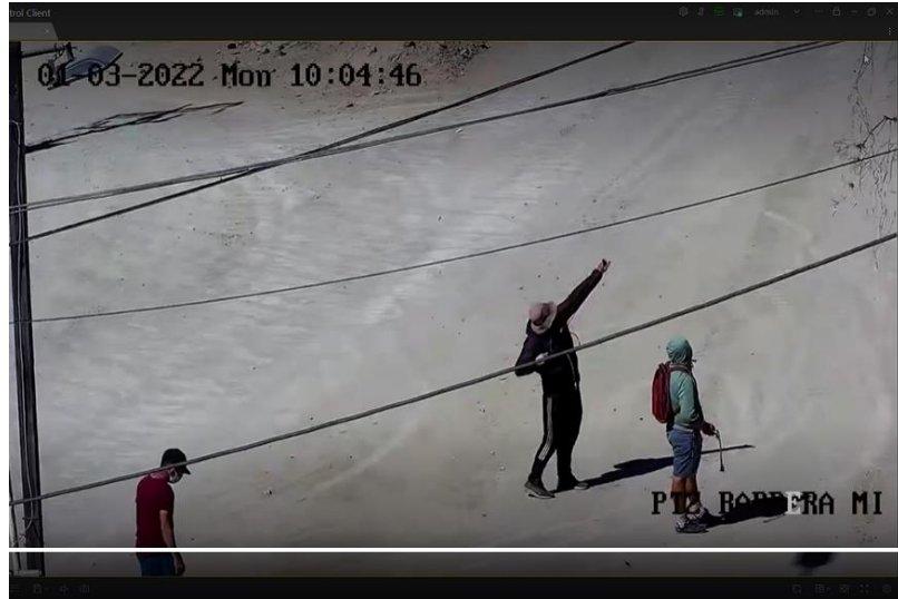
Trabajadores huelguistas lanzando piedra