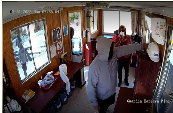
Huelguistas ingresando a garita de seguridad

intentos por destruir sistemas de seguridad -cableado y cámaras- así como herramientas de trabajo del personal de seguridad, que son dejados a su suerte y sin comunicación en un sector donde la violencia y peligro escala minuto a minuto. Todos estos hechos se desarrollaron a partir de las 10:00 am, dando cuenta de una acción coordinada y concertada con antelación por los recurridos.