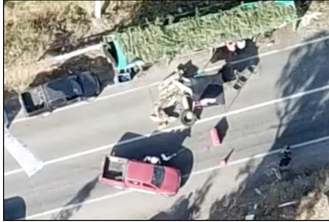
Camioneta roja detenida en la vía