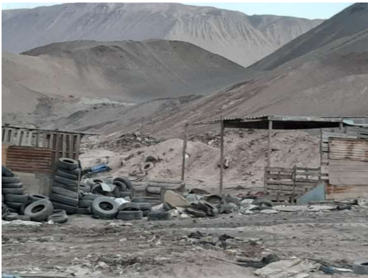
Imagen evidencia montañas de desechos textiles algunos al descubierto, otros semi tapadas con tierra, otros absolutamente tapados con tierra. Imagen captada 26 de marzo de 2022.

En la imagen se puede apreciar, además de ruedas de automóviles descartadas, montañas de tierra que esconden residuos textiles. Imagen tomada el 26 de marzo de 2022.