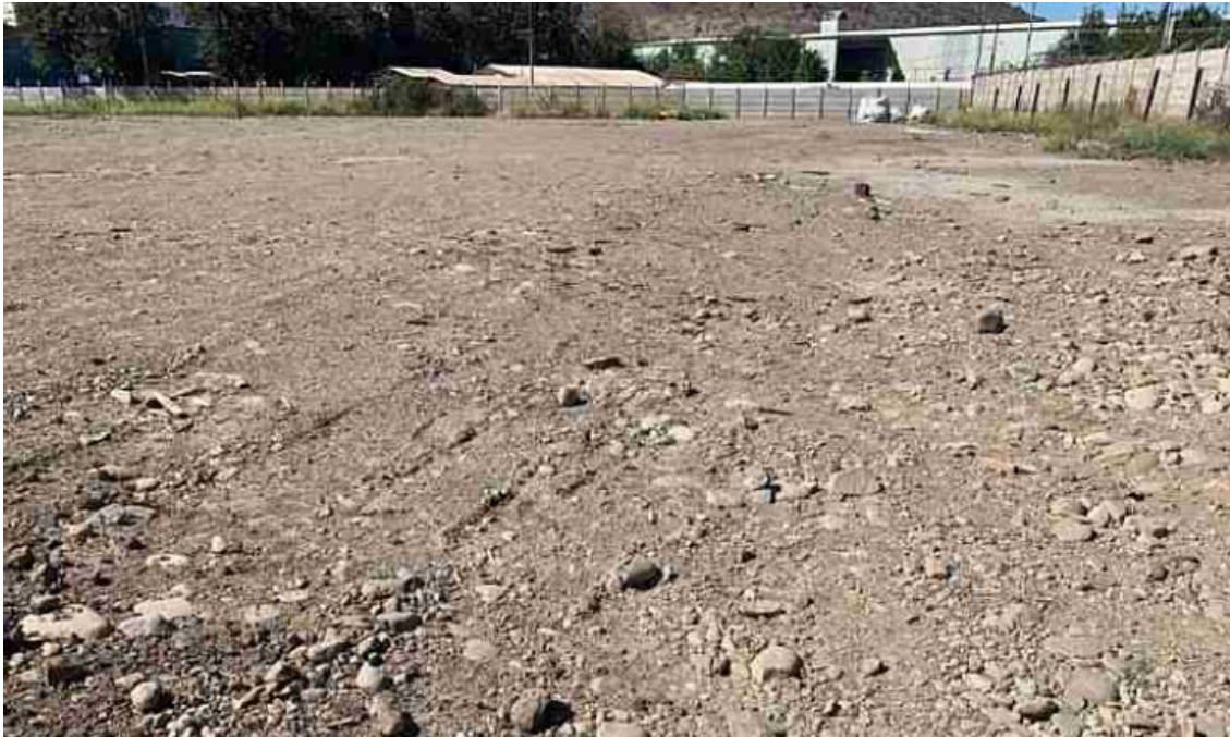
Figura 9. Vista general del predio del proyecto durante la prospección arqueológica.