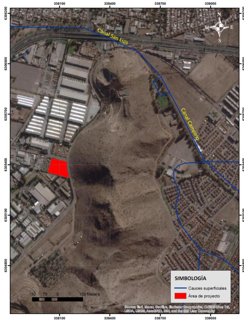
Figura 4. Hidrología actualizada de la zona del proyecto.