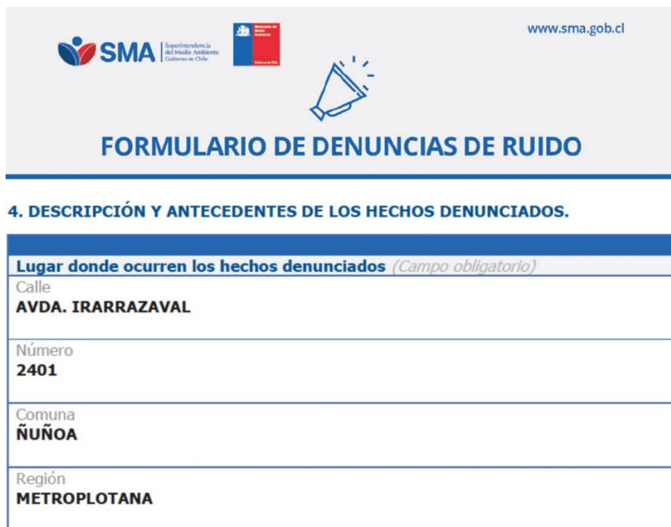
Figura N° 2: Domicilio registrado en el Formulario de Denuncias de Ruido, de la SMA