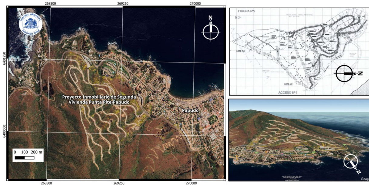
Figura N° 1: Cartografía de contexto territorial proyecto inmobiliario de segunda vivienda Punta Pite - Papudo