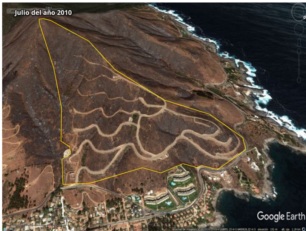
Figura N° 2: Red vial al interior del proyecto de julio del 2010